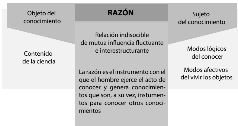
Gráfico 1 Síntesis conocer del conocimiento

Gráfico 1 se observa la síntesis del conocer científico, donde el objeto del conocimiento se relaciona con el contenido de la ciencia, y el conocer científico se relaciona con la razón como un atributo del hombre que ejerce sobre el acto de conocer el mismo que genera conocimientos como los instrumentos para conocer otros conocimientos; en fin, el sujeto del conocimiento son los modos lógicos del conocer y los modos afectivos del vivir los objetos, y lo que se busca es que el conocimiento descubierto se adapte a realidades diversas respetando la cultura e identidad de cada uno de los contextos. A continuación la representación gráfica sobre el conocer científico.