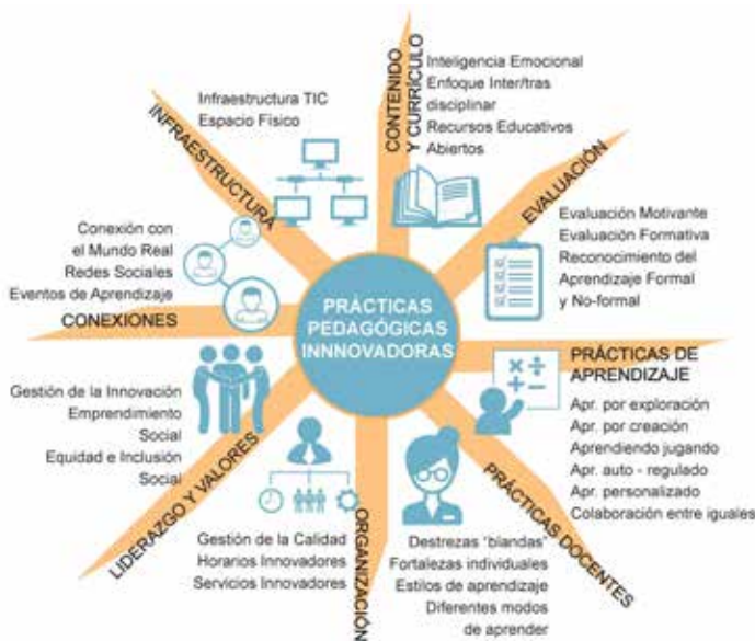
Gráfico 4 Elementos que integran la clase creativa